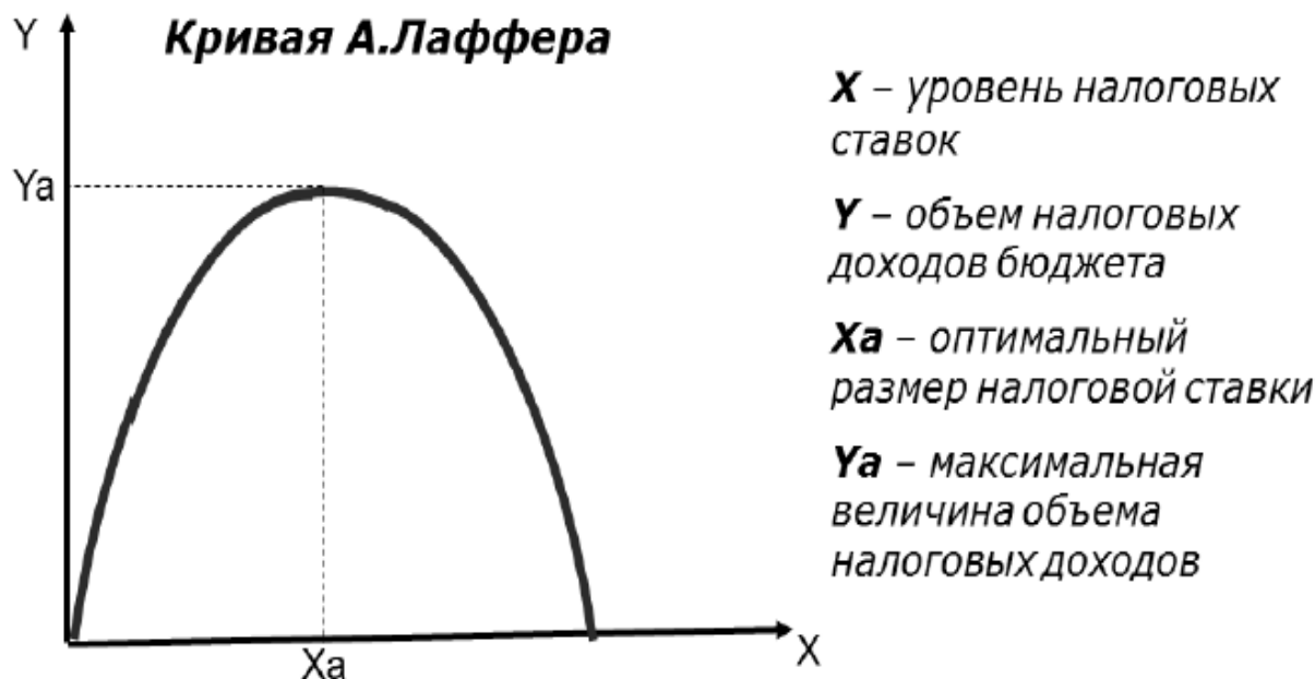
Рис. 2. Кривая Лаффера

Исследуя связь между величиной налоговой ставки и поступлением налогов в бюджет американский экономист Артур Лаффер показал, что повышение налогов может привести к снижению поступлений в бюджет. Смысл кривой в том, что снижение предельных ставок и вообще налогов обладает мощным стимулом воздействия на производство. При сокращении ставок база налогообложения в конечном счете увеличивается (выпускается больше продукции, доходы людей растут, растут налоги) (рисунок 2).