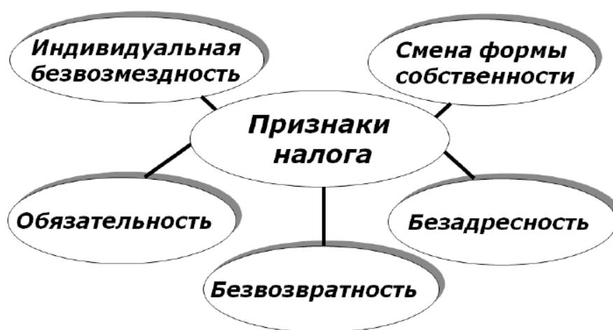
Рис. 1 – Признаки налога

Признаки налога представлены на рисунке 1.